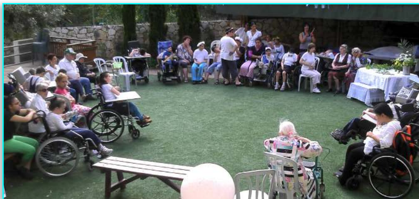
Beboere fra et nærliggende handicaphjem til havefest