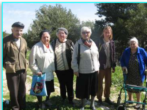
Beboere på udflugt