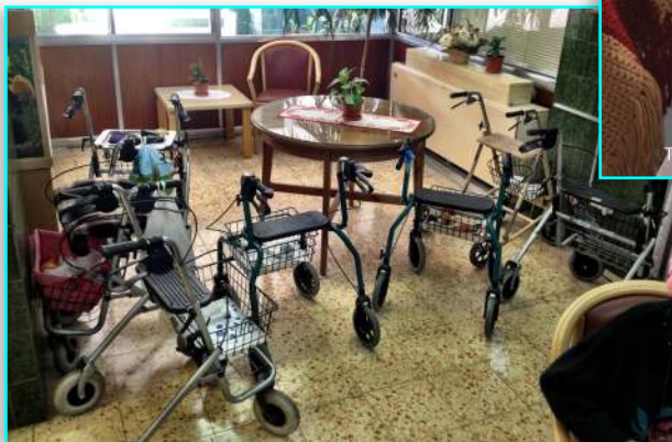
"Parkeringspladsen" på Ebenezer-hjemmet