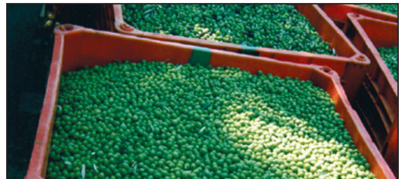
Gud Herren vil føre Israels folk ind i "et herligt land ... et land med olivenlunde ..." (5 Mos 8,7-8) - her olivenhøst.

og accepterede jeg, hvad Gud sendte uden at knække og uden at opgive håbet?