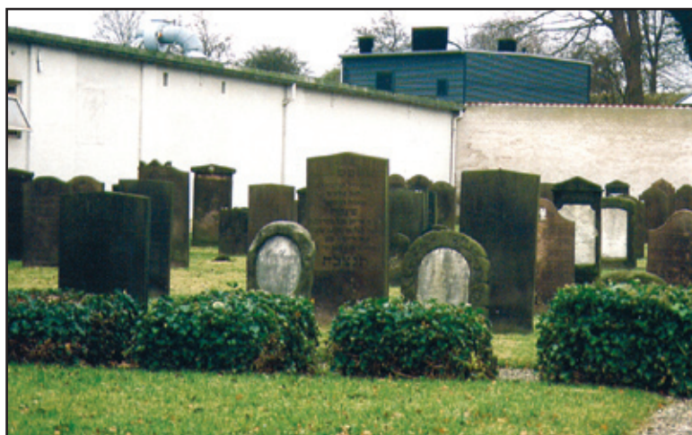
På den jødiske begravelsesplads i Fredericia findes en række gravsten med interessante inskriptioner. – Årsmødet inkluderer et besøg her lørdag eftermiddag.

Den første synagoge blev taget i brug i 1720 – nogle mener, at det var den første tilladte synagoge i Norden. 1810-1812 blev den revet ned, og en anden blev bygget. Den blev ødelagt under bombardementet i 1864, og en ny blev indviet i 1865. I 1914 blev denne synagoge solgt til nedrivning, idet der var så få jøder, at der ikke var blevet holdt gudstjeneste dér siden 1902. Den sidste gudstjeneste blev holdt på Yom Kippur, forsoningsdagen.