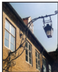
Ydre Missions Hus

Den Danske Israelsmission blev stiftet så langt tilbage som i 1885. I dag har den sit sekretariat i Ydre Missions Hus i Christiansfeld.