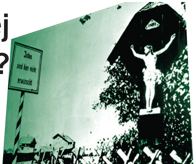
Et billede, som i dag gør ondt, fra 1930'ernes "kristne" Europa. – Den korsfæstede Jesus kigger hen på skiltet "Juden sind hier nicht erwünscht" ("Her er jøder uønskede"). Hvilken "kristen" hån mod Jesus, der kæmpede Israels sag og døde som Israels konge.

Hertil svarer de to forfattere af "nej'et" til jødemission efterfølgende, at spørgsmålet om jødemission på afgørende måde hænger sammen med, om man