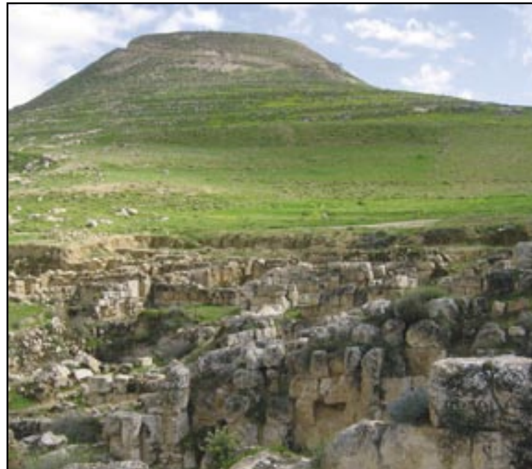
Fæstningen "Herodion" rejser sig som en vulkan i landskabet 5-6 km sydvest for Betlehem.

hele den kongelige pragt komme til udfoldelse ved ligtoget. Ligbåren var af massivt guld og broderet, liget, som lå på det, var indhyllet i purpur, kongediademmet var anbragt på hovedet, og over det var der en gylden krans, og i højre hånd holdt han sceptret. ... Liget blev ført 70 stadier bort til Herodion, hvor det blev begravet, således som kongen havde befalet det. Således endte Herodes' historie.”