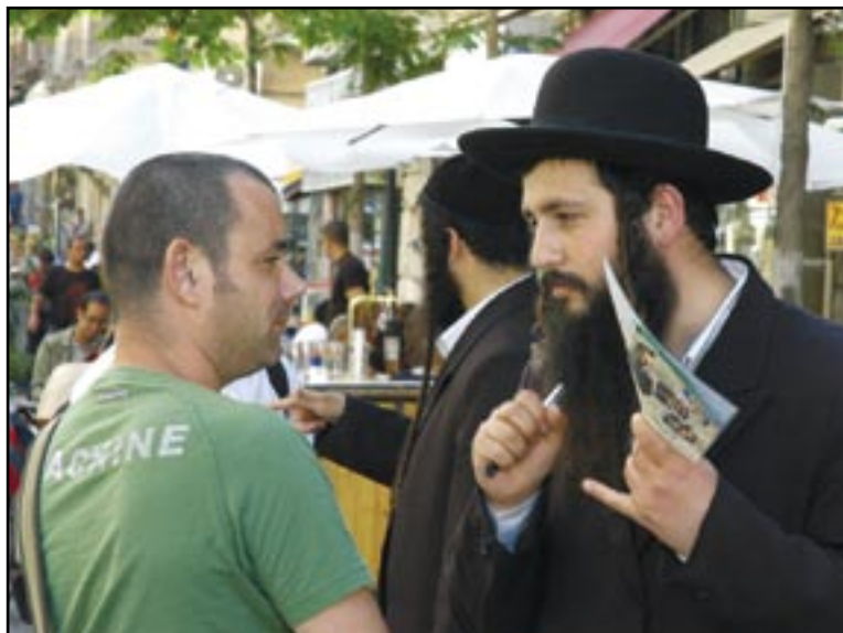
Ortodoks jøde i samtale med sekulær jøde: "Du skal elske Herren, din Gud af hele dit hjerte."

Lad os håbe og bede om, at den lille surdej snart må gennemsyre hele dejen.