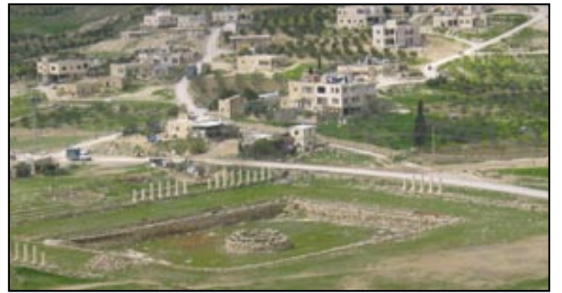
Hidtil har man troet, at Herodes' grav skulle findes ved det nedre palads (foran pool'en), men nyt fund har sandsynligvis afsløret gåden om graven.

meter bred trappe under klippens overflade på den nordøstlige side af klippen. Trapperne ledte op til en indhugget platform, der var lavet af hvide tilhuggede kvadresten, hvor ruiner antydede et muligt mausoleum. På platformen fandt han over 100 fragmenter af en sarkofag. Den var lavet af fine røde kalksten fra Jerusalem-området, ornamenteret med dekorative rosetter. Sarkofagen var 2,5 meter lang og havde et trekant-lignende dække, udsmykket på alle sider. Der var ikke afbilleder af noget menneskeligt eller lignende, som kunne stride mod jødiske religiøse love. Måske et udtryk for, at