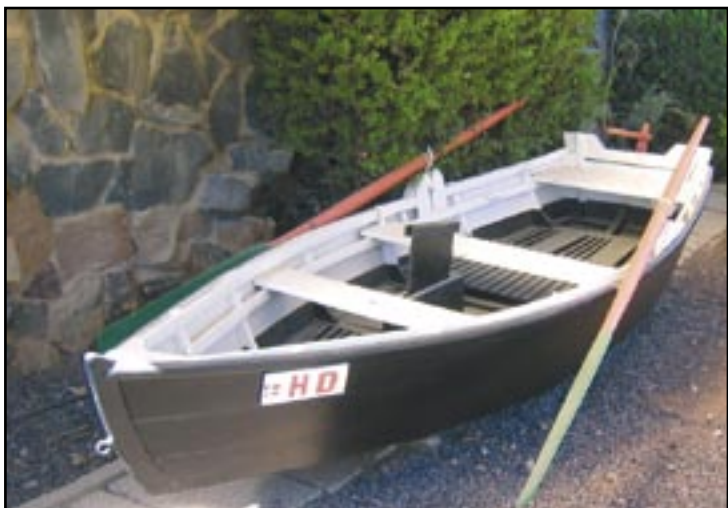
"... det lykkedes os at redde næsten alle de 7000 danske jøder ... Men ..."