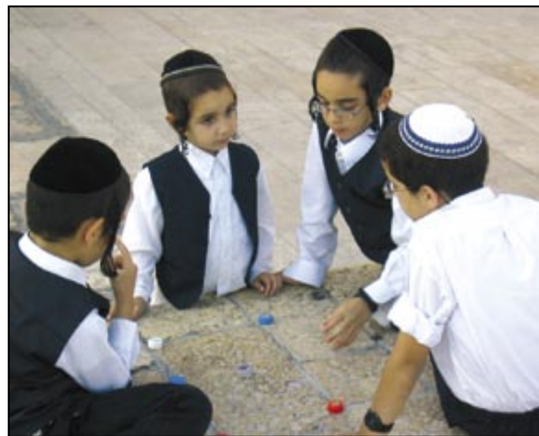
Overrabbiner Shlomo Amar vil gerne have, at flere israelere kommer til at leve som jøder.

I dag har vi som Israelsmission også langt den største del af vores arbejde i Israel. Sådan har det ikke altid været, nemlig den gang staten Israel endnu ikke var oprettet, og sådan behøver det ikke være. For Israelsmission er, når det kommer til stykket, jødemission – og handler om at