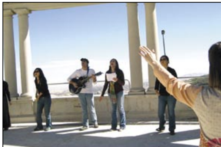
Gad vide, om kristne danske studerende ville synges lovsange i det fri – sådan som israelske studerende gør det på Det Hebraiske Universitet.

Hun tager mig med ud i parken, hvor vi skal mødes med en lille gruppe af de studerende. "Grup- pen startede i januar og er en af de 3-4 blandede grupper inden for FCSI's arbejde på landsplan," fortæller hun mig. Det er en af årets varmeste dage, så vi finder nogle hyggelige bænke i skyggen. Det slår mig, at det nok alligevel var de færreste KFS-grupper i Danmark, som ville sætte sig og synges lovsange i parken foran skolen. 12 dukker op til mødet, og der falder nogle lystige kom-