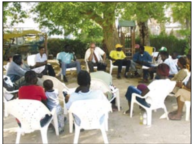
Flere forskellige grupper i Israel forsøger at hjælpe de flygtede sudanese – deriblandt palæstinensiske kristne og messianske jøder.

Nogle af de sudanesiske flygtninge, hvoraf mange har været på flugt i 6-7 år, har fået lov til at arbejde på kibbutzer i Negev. Andre på hoteller i Eilat, mens andre igen sidder i israelske fængsler eller på hærens baser, indtil en løsning er fundet. En række grupper i det israelske samfund forsøger at komme dem til hjælp. Således også en gruppe, hvis sammensætning viser, at det ikke kun er nøden, der ikke kender grænser. Det gør barmhjertighed heller ikke. Og denne gruppe har måske med sit ønske om at vise