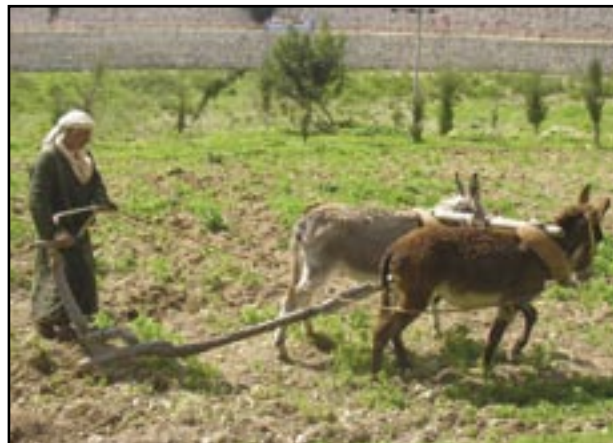
Her ryddede de marken for stene engang...

På skråningerne ligger flere ruiner. Mest overraskende er ruinerne af et storslået romersk palads med