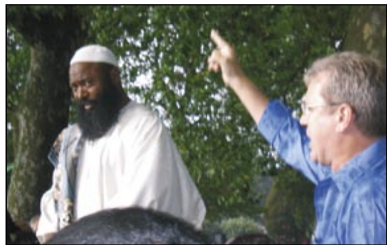
Der er frihed både i Danmark og Israel til at forkynde om Jesus. Undertiden mangler frimodigheden til det. I modsætning til her i Hyde Park i London, hvor en kristen frimodigt forkynder og debatterer med en muslim.

Om de første Jesus-troende jøder i Jerusalem fortæller Apostlenes Gerninger, at de fyldt af Helligånden forkyndte Guds ord med frimodighed. Selv i fængslet i Rom "prædikede Paulus om Guds rige