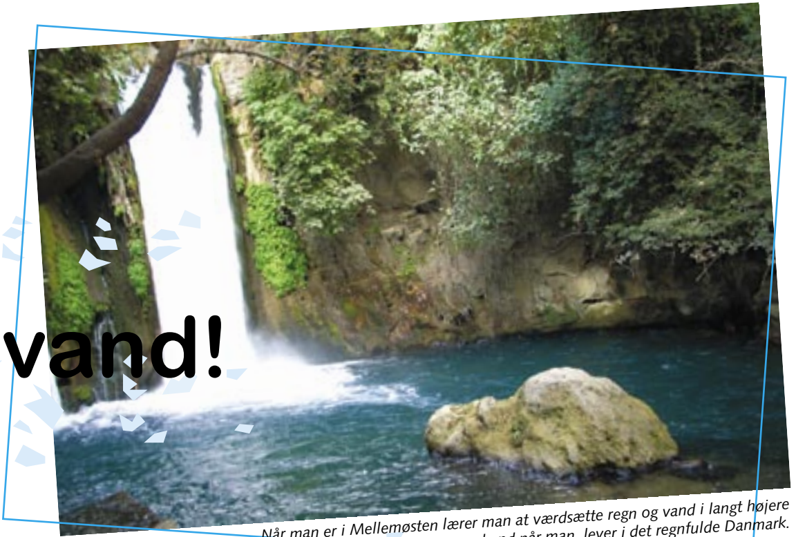
Når man er i Mellemøsten lærer man at værdsætte regn og vand i langt højere grad end når man lever i det regnfulde Danmark.

Vi tog turen for nogen tid siden ned til Siloadammen, hverken festklædte eller brogede, men dog anført af en præst – Olsen. Man har kun lige akkurat fået udgravet den dam, som Herodes den Store byggede. Det var ved lidt af et tilfælde, at den blev opdaget. I forbindelse