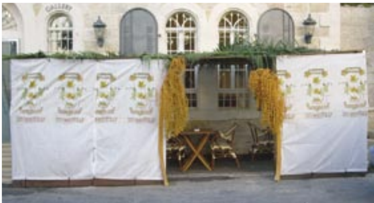
En af de mange festlige løvhytte-telte, der skyder op i Israel under Løvhyttefesten.

Men det var godt nok hverken Blitzkrieg eller turister, jeg først