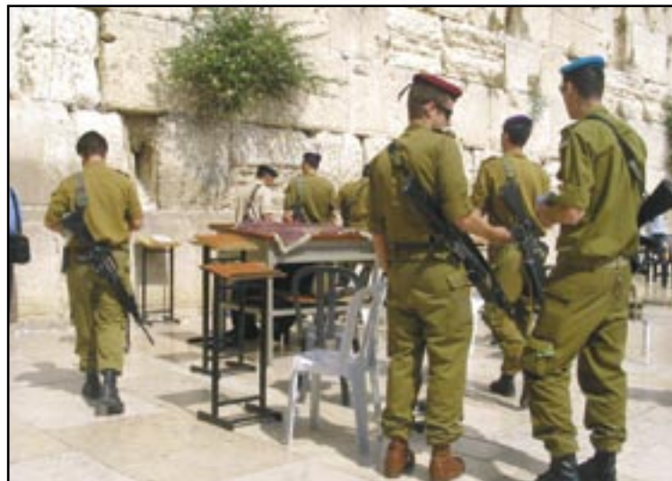
2.000 israelere er konverteret til jødedommen det sidste år. Halvdelen af dem er soldater, der er gået over til jødedommen via det program, som den israelske hær administrerer.

kristnes konvertering til jødedommen i Israel i løbet af de sidste 12 måneder. I sammenligning med tallene fra denne rapport ser de to, som var blevet døbt i Immanuel Kirken, eller de 25-30, som jeg gætter mig til, ikke ud af meget. Af rapporten i avisen Ha'aretz fremgår det nemlig, at omkring 2.000 israelere er konverteret til jødedommen det sidste år. Halvdelen af dem er gået over til jødedommen via det program, som den israelske hær administrerer. Der er omkring 6.000 soldater i den israelske hær, som ikke er jøder, og de udgør en særlig målgruppe for det arbejde, som immigrationsministeriet i samarbejde med Jewish Agency gør for at få ikke-jødiske soldater til at konvertere. De fleste af dem kommer fra rus-