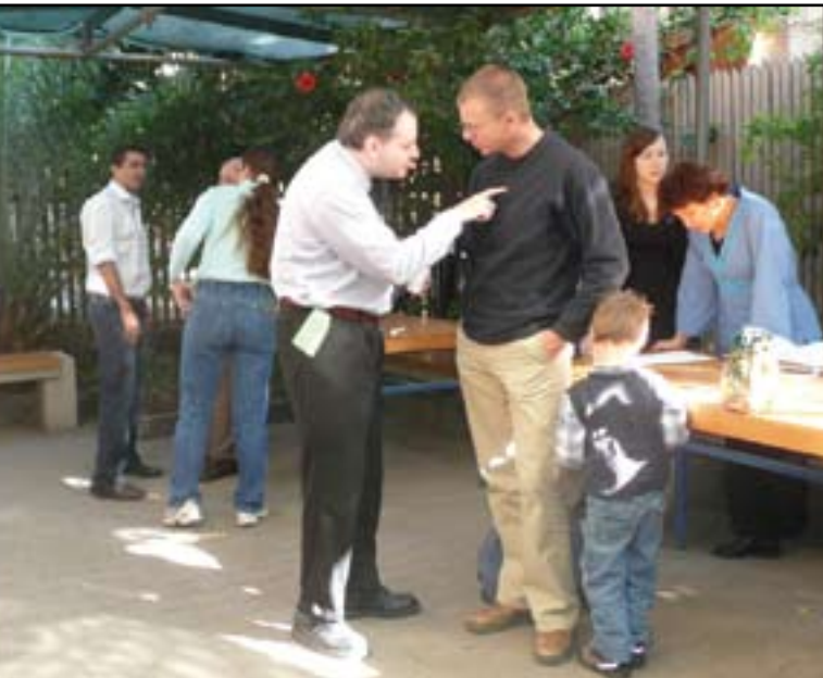
Livlig debat: Jøden Jesus af Nazaret – og hvordan skal vi forholde os til ham?