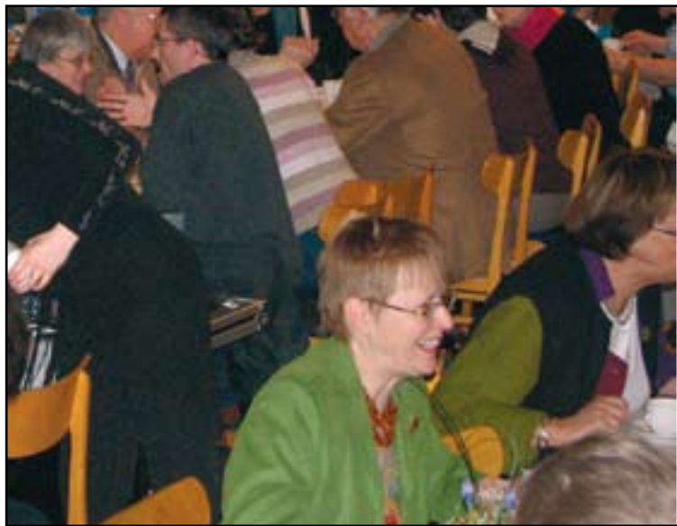
Alle er velkommen til årsmødet – Israelsstævnet. Tag gerne familie og venner med.

Se mere på www.israel.dk eller rekvirer et program fra sekretariatet.