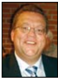
Af Hans-Ole Bækgaard, Jerusalem