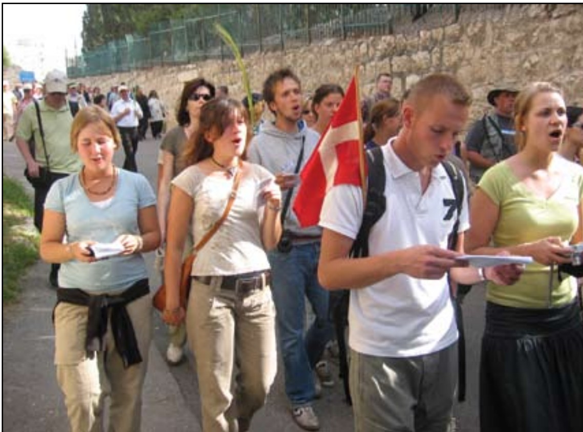
Unge danskere gør gennem Den Danske Kirkes arrangementer opmærksom på en kristen dansk eksistens i Jerusalem. – Her ved en Palmesøndags-procession.