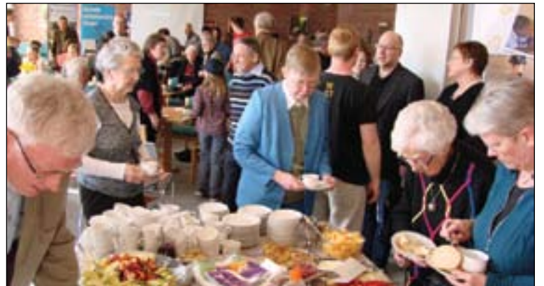
God forplejning og hygge hører sig til på et årsmøde

Sådan også i år, hvor overskriften var "Når jøder møder Jesus". Vi var samlet i menighedslokalerne til den kirke, der meget passende hedder Zions Kirke.