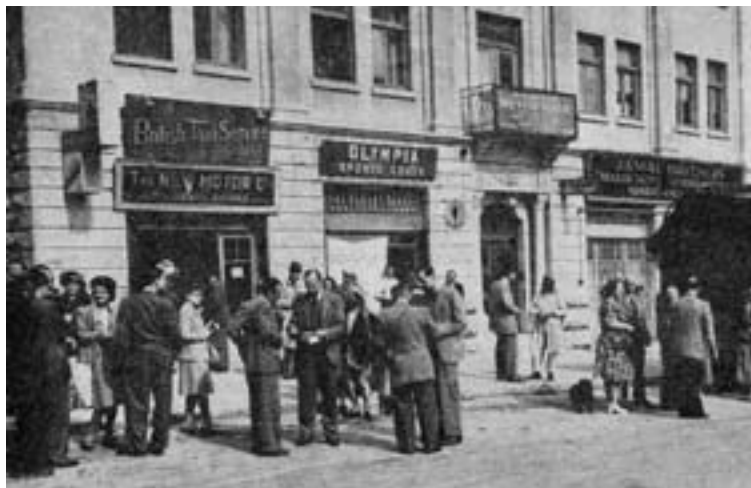
Jesus-troende jøder inden for Jaffa Gate i Jerusalem forud for at de evakueres gennem Operation Mercy.