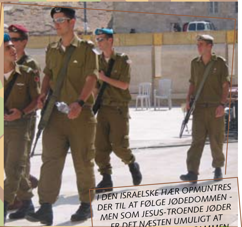
I DEN ISRAELSKE HÆR OPMUNTRES DER TIL AT FØLGE JØDEDOMMEN - MEN SOM JESUS-TROENDE JØDER ER DET NÆSTEN UMULIGT AT FINDE TID TIL AT VÆRE SAMMEN.

Efter at vi i snart en måned havde mødtes over telefonen, ringede min nye ven til mig og sagde: "Jeg har nu 20 minutter, hvor vi godt kan mødes. Hvor er du og er det i orden med dig hvis der er to andre som også vil mødes med os." Vi var altså flere messianske jøder på samme base. Jeg blev både chokeret og