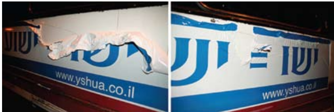
Ikke alle jøder i Israel syntes om Jews for Jesus' Jesus-kampagne og ødelagde reklamerne på busserne. Men når det var muligt blev de vandaliserede reklamer repareret.

Vores oplevelse af et navn er således meget subjektiv og styret af en lang række faktorer, fx af historisk, religiøs, kulturel, socio-