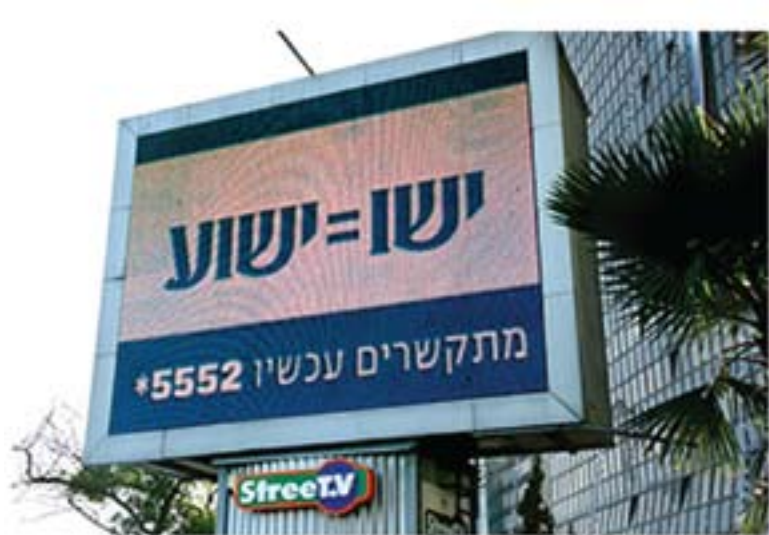
Jews For Jesus brugte roterende gadereklamer i deres kampagne. Læst fra højre: Jeshu/Yesu = Jeshua/Jeshua

Gennem tiderne har troldmænd – hvad enten de var af jødisk eller kristen herkomst - forsøgt at bemægtige sig kraften i Jesus-navnet. Et tidligt eksempel herpå