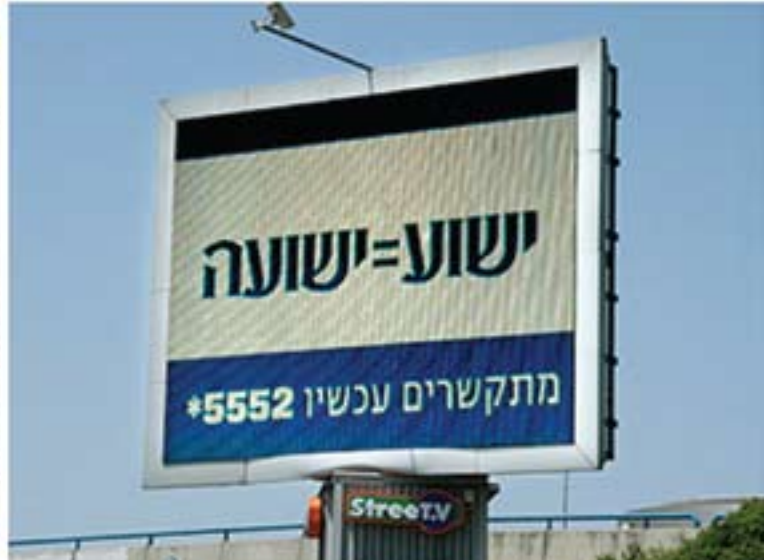
Jeshua/Jeshua = Jeshuah/Jeshuah; det sidste betyder på hebraisk "frelse"

findes i Apost-lenens Gerninger 19,13-20, hvor Skeuas' sønner, nogle jødiske dæmonbesværgere, besværgede nogle demoner "ved den Jesus, som Paulus forkynder". En sådan brug af Jesus-navnet tages der i NT afstand fra.