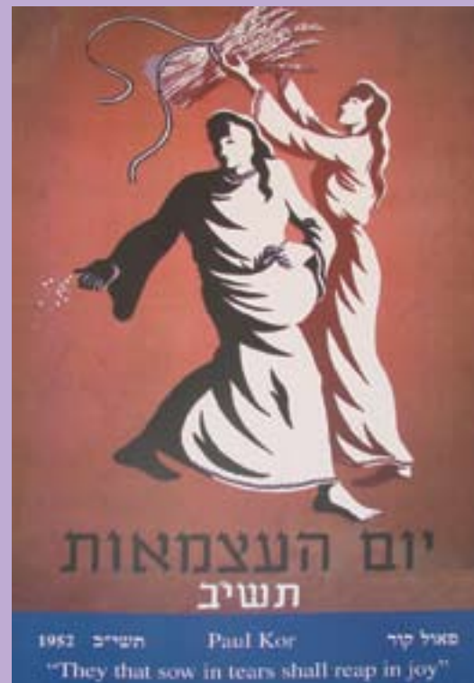
Da Ursula vendte tilbage til Israel i 1952 så årets plakat til Uafhængighedsdagen sådan ud. "De, der sår under tårer, skal høste med jubel" (Salme 126,5).

Deres livshistorie er for os en påmindelse om, at man ikke skal være for hurtig med at fælde domme over dem, der i foråret