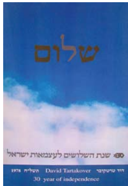
30-året for staten Israels selvstændighed i 1978 blev fejret med denne plakat, hvor der på hebraisk står "Shalom". Det var for 30 år siden udtryk for et ønske. I 60-året for den nye stats oprettelse - her i 2008 - må vi fortsætte med at bede om Shalom - fred - for de stridende parter i Mellemøsten.