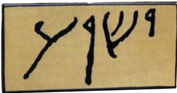
Jeshua-navnet fra en gravinskriftion i Palæstina på Jesu tid.