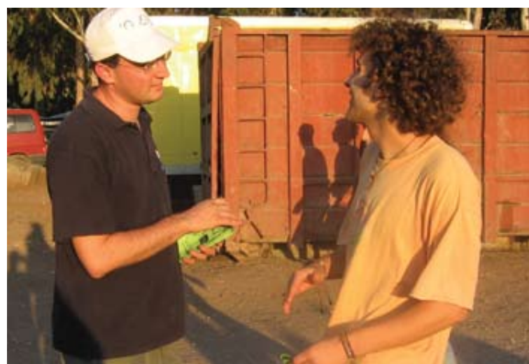
At dele evangeliet med jøder betragter Israelsmissionen ikke som et udtryk for "antijødisk retorik og teologi".

Med udgangspunkt i denne notits vil jeg tage to forhold op. For det første nogle ord om bønnen for Israels frelse, Israel her forstået som folket Israel . Og for det andet vil jeg sige noget om, hvordan man i det 19. århundrede reagerede på manglende succes i arbejdet for jøders frelse.