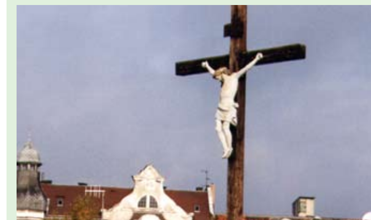
Paulus: "Vi prædiker Kristus som korsfæstet, en forargelse for jøder og en dårskab for hedninger" (1 Kor 1, 23).

Gud har forpligtet os til at forkynde ordet, så troen kan skabes. Selv er han ikke bundet af dette forhold. Hvad Gud ellers måtte gøre for at få mennesker i tale, er hans sag. Paulus kom ikke til tro ved, at nogen forkyndte ordet for ham. Han mødte Jesus, eller rettere: Jesus mødte ham i en direkte åbenbaring på vej til Damaskus. Lukas lader Paulus fortælle om sin omvendelse og sit kald tre gange i Apostlenes Gerninger. Men for Paulus er måden, han kom til tro på, ikke normativ for andre. Han siger ikke: Vent på direkte åbenbaringer eller visioner. Han siger: forkynd! For troen kommer af det, som høres. Og hører man til dem, der i dag får direkte åbenbaringer fra Gud, er man forpligtet på at henvise andre til det åbenbarede ord i Skrifterne.