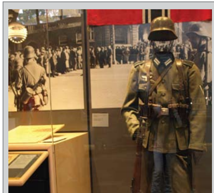
Den Danske Israelsmission kæmper imod enhver form for antisemitisme. Ved årsmødet i København i marts måned blev der arrangeret en tur med besøg på Frihedsmuseet – og dermed påmindelse om Holocaust.

Selv om disse "støtte"-projekter er en bekræftelse for jøder, så sker det ofte ved at undgå en direkte omtale om korset. Accept opnås ved at eliminere det, som kunne være en forargelse. Denne længsel efter at blive accepteret af jøder snarere end at ønske frelse for dem, er i stor udstrækning et resultat af tyske kristnes skyldfølelse for Holocaust. Vi må hjælpe kristne til at forstå, at en kærlighed til det jødiske folk, som ikke er parat til at dele evangeliet med dem, i sidste ende er ubielsk. Vi må hjælpe tyske kristne til at forstå, at sand forsoning mellem mennesker ikke findes uden den enkeltes forsoning med Gud gennem Jesus. Vi må hjælpe tyske kristne til at forstå, at Guds største ønske for det jødiske folk ikke er, at de får et nyt sted, men et nyt hjerte; at det vigtigste spørgsmål ikke er, hvornår vi vender tilbage til landet, men om vi vender tilbage til Herren.