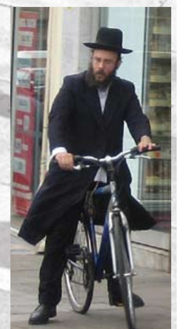
Stamford Hill har Englands største koncentration af chasidiske jøder.

VIL DU VIDE MERE OM JØDERNE I LONDON, SÅ TAG MED PÅ IU'S STUDIETUR I OKTOBER 2009.