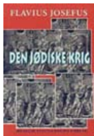
Josefus' bog "Den Jødiske Krig" er stadig en læsning værd. Den findes i dansk oversættelse af Erling Harsberg og er udgivet i 1997 på Museum Tusulanums Forlag, København.

Striden mellem hærens rabbinere og uddannelsesfolk er også