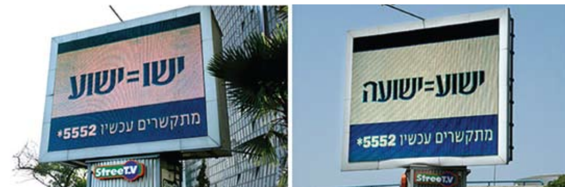
For messianske jøder er det vigtigt, at Jesus hedder Yeshua på hebraisk. De fleste israelere kalder ham Yeshu. Emnet blev behandlet i Israelsmissionens Avis, august 2008. Læs artiklen igen på www.israel.dk