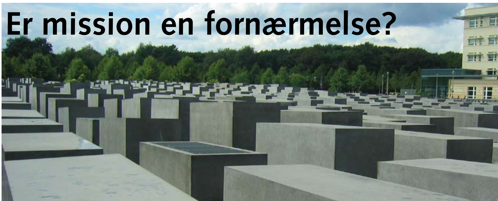
Monumentet oven over Holocaust-museet i Berlin.