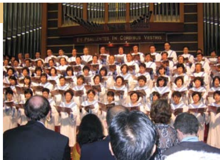
Det lod helt himmelsk, da et koreansk kor sang Hallelujakoret fra Händels Messias ved en gudstjeneste under konferencen.