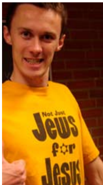
Vi glæder os meget til næste års Fall Fuel 2010 d. 29-30. oktober.