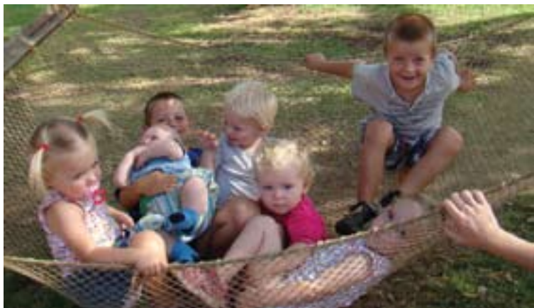
Udsendingenes børn - i fred med hinanden...!

Nu har vi efterhånden mødt deltagere fra den slags forsoningsprojekter en del gange de seneste år – også i Danmark, og