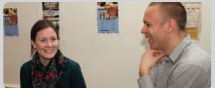
Vi ses til Shalom Night og Israelsstævne d. 19-20. marts 2010 i Christiansfeld.