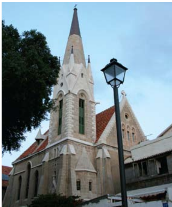
Israelsmissionen udvider i 2011 sin støtte til Immanuelkirken i Jaffo ved at betale løn til en lokal medarbejder.

Og apropos mission og plan B, så har Gud heller aldrig haft en plan B, når det gælder hans mission for verden: Gennem Abraham og hans slægt at velsigne alle jordens slægter, så enhver må kende hans magt og hans frelsesvilje. Derfor udvalgte han Israel og holdt fast i dem, selv om de blev både blinde og døve. Han kaldte dem til at være sine vidner. Ligesom Jesus efter sin opstandelse og efter at være blevet både forrådt og forladt af sine disciple kaldte dem til at være vidner om det, de havde set og hørt. Han havde ikke en plan B, og det har Gud fortsat ikke.