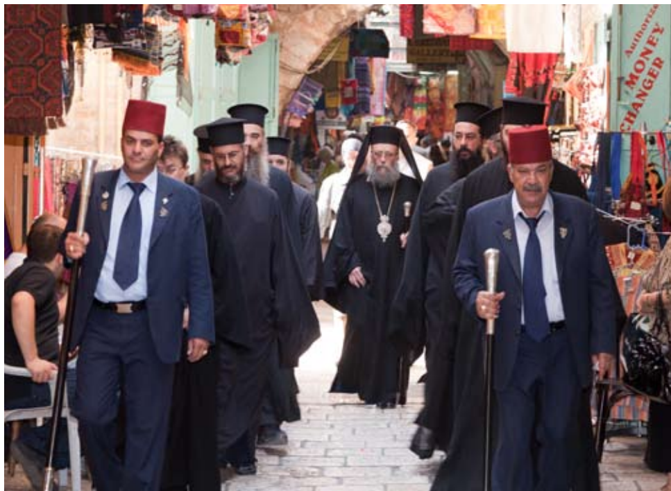
Et ædelstensbelagt kors føres i procession. Gør plads for korset – eller blive mast.

I brøkdelen af et sekund mærker jeg en tilfreds fornemmelse – før det slår mig: korset af træ ved New Gate; søndagens tekst, jeg