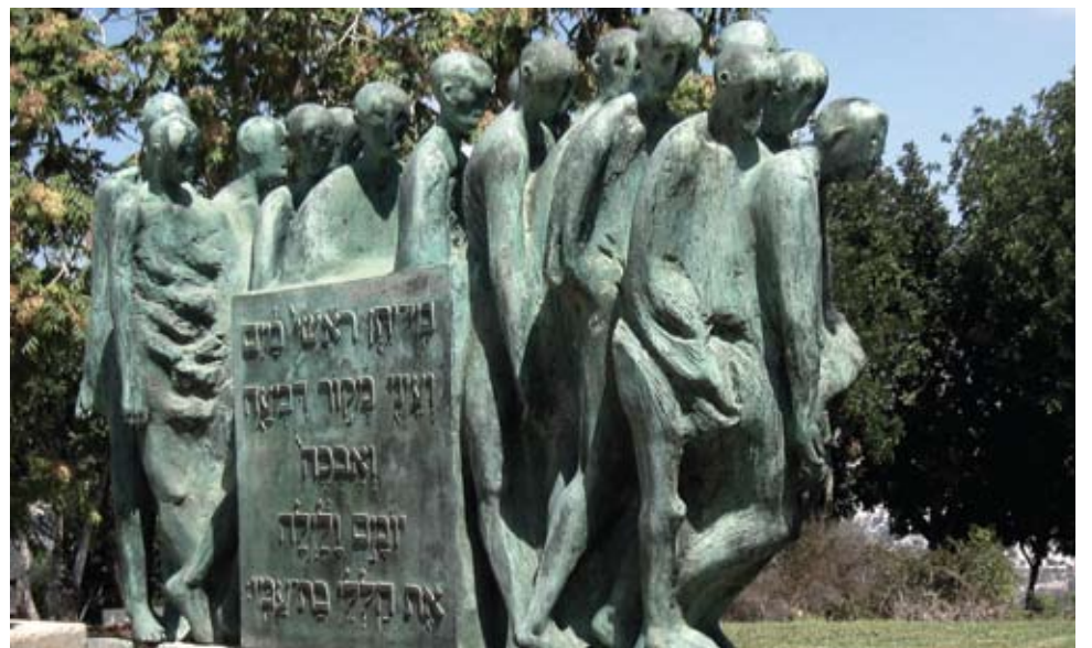
Holocaust-skulpture ved Yad Vashem-museet i Jerusalem.