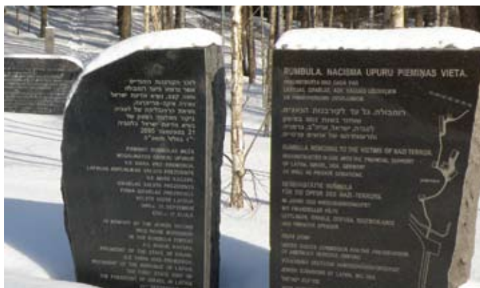
Vi kan – fordi vi husker – måske gøre en forskel for fremtidens potentielle ofre for had og folkemord. Her mindestene fra Rumbula.

Men som Israelsmission har vi en særlig opgave i at tale og handle imod den antisemitisme, som fortsat findes, om end den tager sig anderledes ud. Derfor er det vigtigt at huske, og derfor fortæller vi om den kommende konference i Riga, "Rumbula – aldrig igen". Men lad os altid huske, hvorfor vi skal huske. Ikke for at fastfryse et billede af fortidens ondskab eller legitimere det samme i nutiden. Erindringer kan gøre os til fortidens fanger, og det gavner ingen. Heller ikke dem, som blev fortidens ofre. Men vi kan, fordi vi husker, måske gøre en forskel for fremtidens potentielle ofre for had og folkemord. Vores, Israelsmissions, opgave er at gøre det i forhold til det jødiske folk.