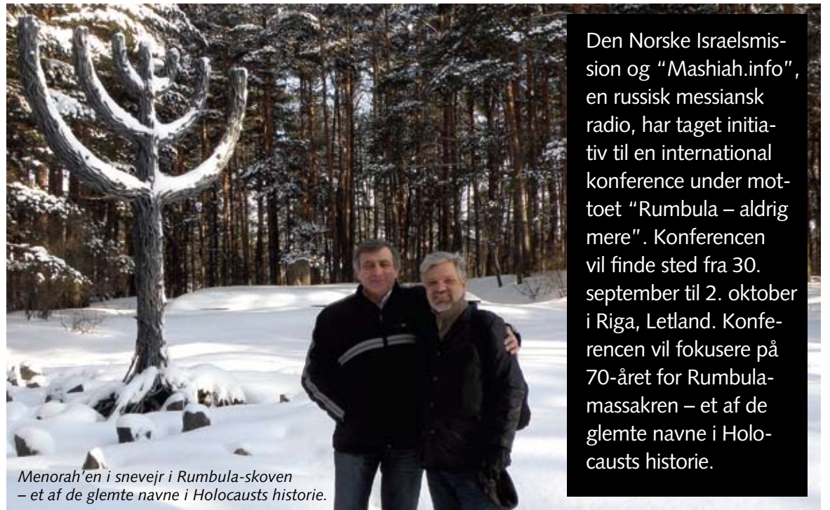
Menorah'en i snevejr i Rumbula-skoven – et af de glemte navne i Holocausts historie.