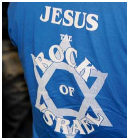
Budskab på to t-shirts ved sommerens internationale konference om jødemission: Spørgsmål: Hvem er han? Svar: Jesus – Israels klippe