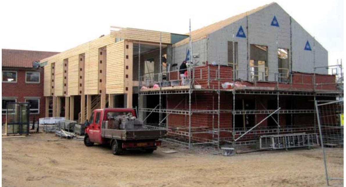
TORVETS facade er ved at være på plads. Vi glæder os til at indtage interiøret i begyndelsen af foråret 2012.

Israelsmissionens årsmøde afholdes på TORVET i Aarhus lørdag den 24. marts 2012. I forbindelse med årsmødet skal der foretages valg til landsstyret.