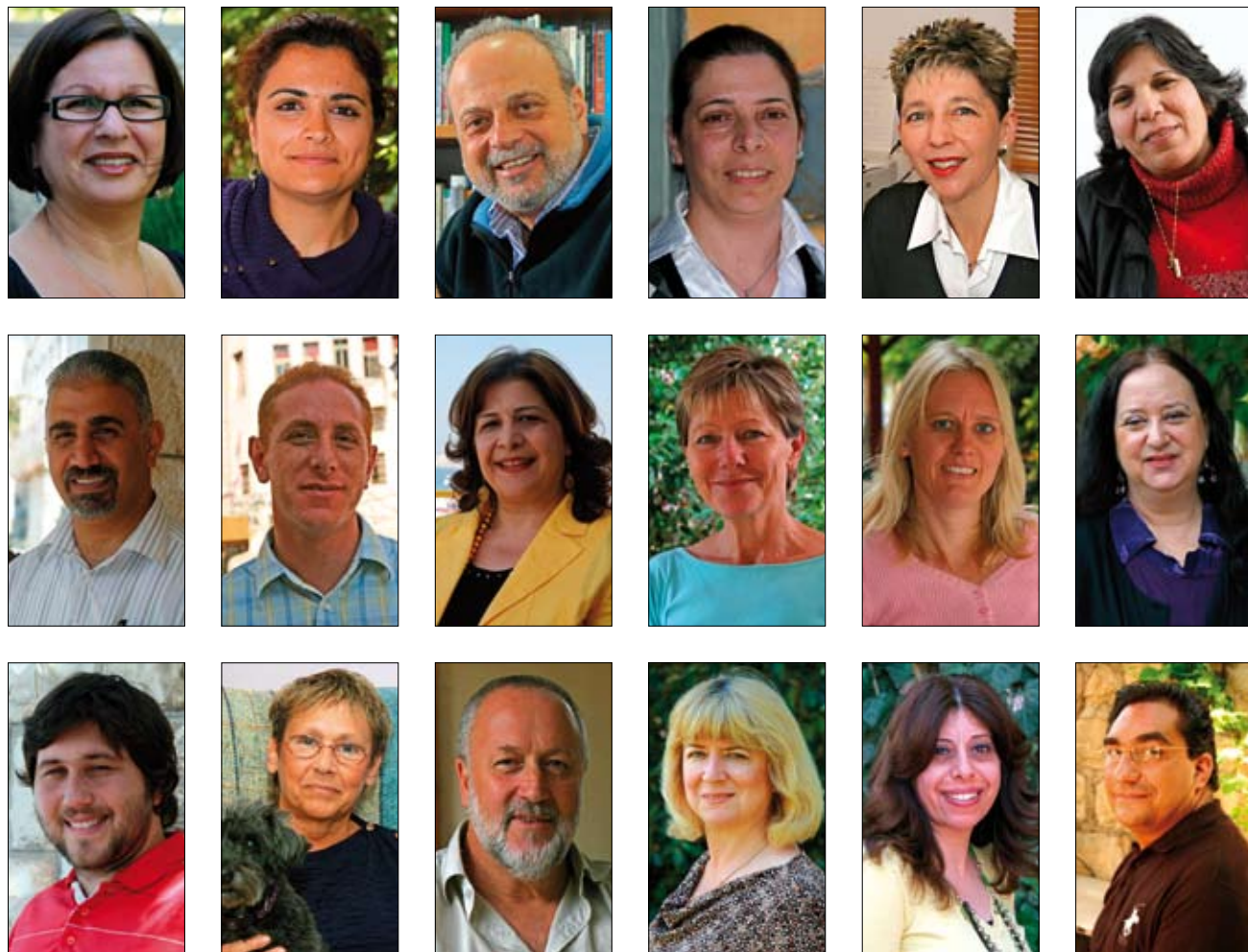
I bogen "Forsoning i kløfternes land" fortæller Jørgen Hedager Nielsen om disse 18 personer og deres forhold til forsoning.

Gud havde forberedt mig Salims identitet blev udfordret, så han begyndte at stille en masse spørgsmål. Og nogle af spørgsmålene var også om Jesus.