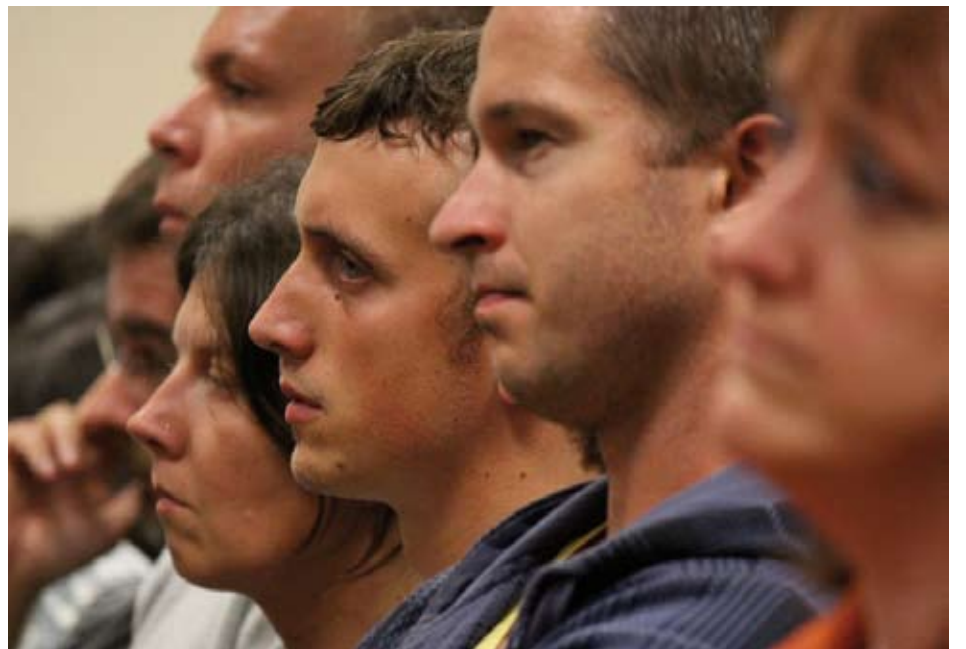
Danske deltagere ved sommerens konference om jødmission fortæller på årsmødet om deres møde med andre personer og deres måde at vidne om Israels Messias.