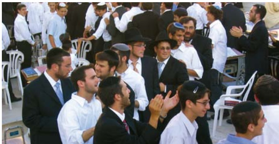
Som Israelsmission har vi et særligt ansvar for den retorik, vi selv bruger i omtalen af jøder – uanset observans.