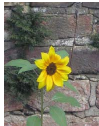
Solsikke vokset direkte ud fra en mur i Theresienstadt