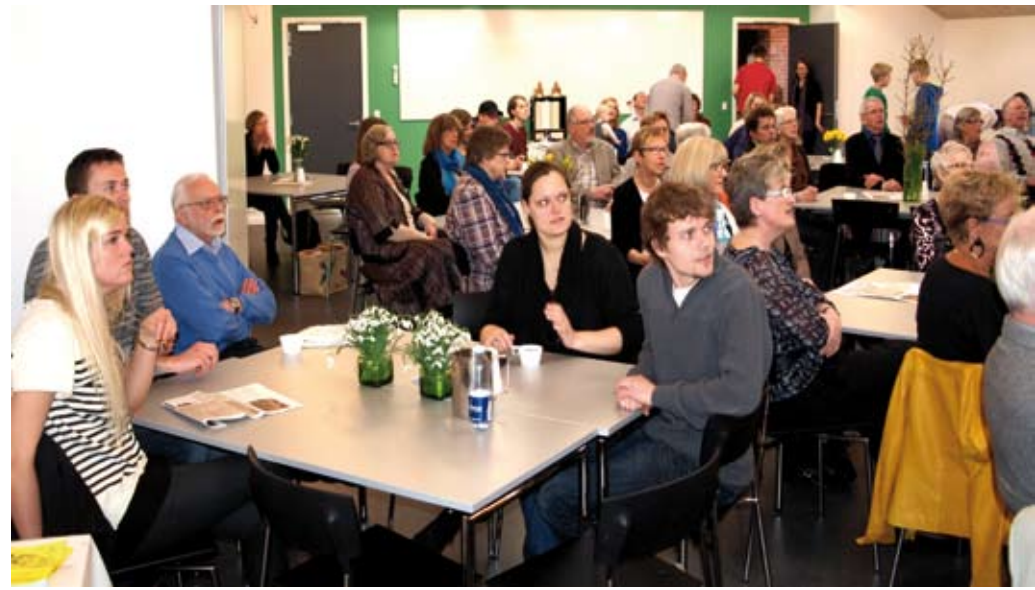
Årsmøde på TORVET.

Temaet er lånt fra den konference om jødemission, som Lausanne-rådet for jødemission (LCJE) lod afholde på konferencen High Leigh nord for London i august 2011. Af de omkring 180 deltagere var ti fra Den Danske Israelsmission og Israelsmissionens Unge. Disse ti udgjorde den fjerde største gruppe fra et enkelt selskab, som deltog i konferencen.