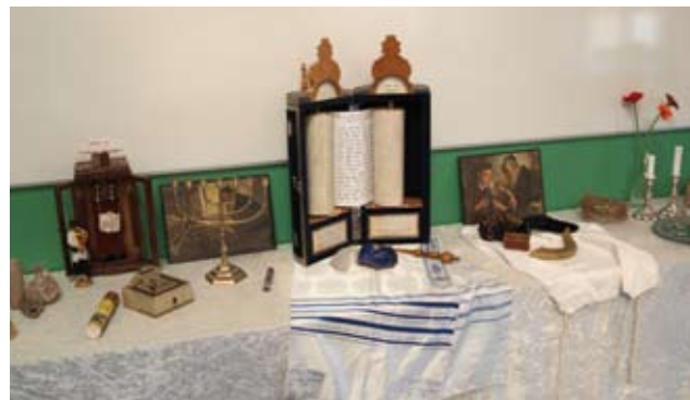
Udstilling ved årsmødet.

- Om vi har været med nok eller gjort det godt nok? Det har jeg ikke tid nok til at udtale mig om her. Om Den Danske Israelsmission gennem sit arbejde har oplevet store vækkelser, kan der gives et kort og klart svar på: nej, det er ikke tilfældet. Det drejer sig om enkeltpersoner, der her