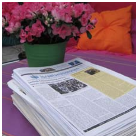
25 årgange af Israelsmissionens Avis.