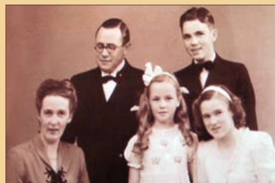
Familien Liepelt i 1949 – mens det endnu var uvist, hvor de skulle være missionærer for Israelsmissionen.

Gennem årsberetningen blev der givet en påmindelse om, at vi ikke skal lade os styre af, om resultatet af vort arbejde forekommer magert. For som det blev sagt mere end én gang: "Guds engle glæder sig, når én – én – synder omvender sig og bliver døbt, jøde såvel som ikke-jøde."