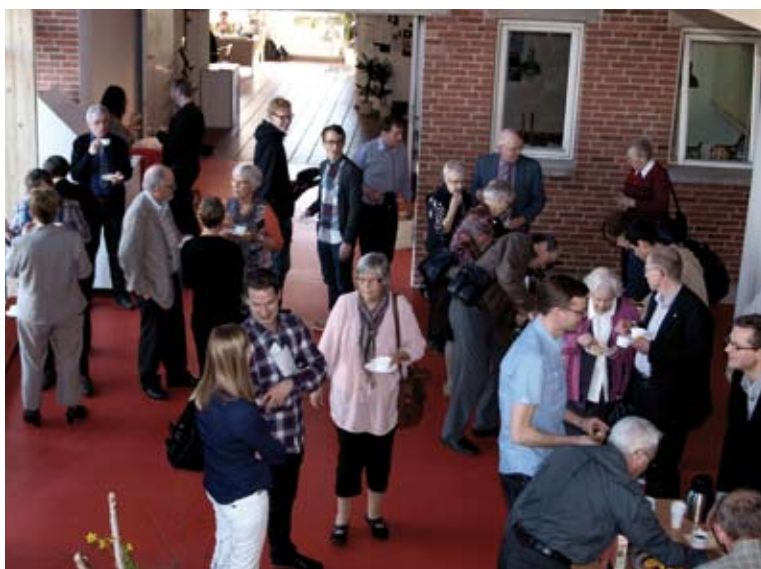
Ved Israelsmissionens årsmøde deltog omkring 100 personer. Her nogle i foyeren ved hullet mellem bygningen Menighedsfakultetet og bygningen TORVET.

I strålende solskin blev Israelsmissionens årsmøde afholdt på TORVET i Aarhus lørdag den 24. marts. Den nye bygning, som var blevet åbnet to uger tidligere, danner ramme for det nye netværksfællesskab mellem Menighedsfakultetet, Ethiopmissionen og Israelsmissionen.