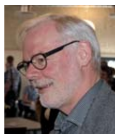
Biskop Steen Skovsgaard