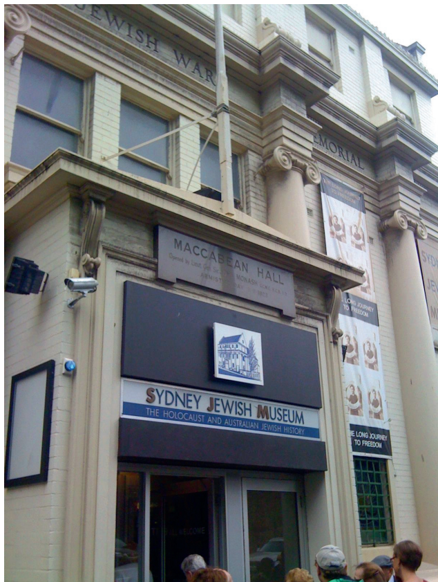
Det Jødiske Museum i Sydney har bl.a. til formål at undervise om Holocaust og udforske jødisk religion, kultur og tradition.

hvad han betyder for dem - personligt. Bed om, at jødernes hjerter må åbne sig, så de ikke kun "shopper" forbi butikken og køber noget hovedløst for at have en undskyldning for at komme forbi til en uforpligtende snak, men at de må gå fra butikken med åbne hjerter over for Jesus.