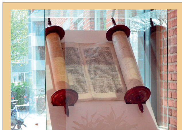
Israelsmissionens 400 år gamle tora-rulle er nu endelig kommet i montre. Den står i TORVETs foyer, så det er noget af det første, man ser, når man kommer ind ad hovedindgangen. Tora-rullen er "slået op" på 3. Mos 16