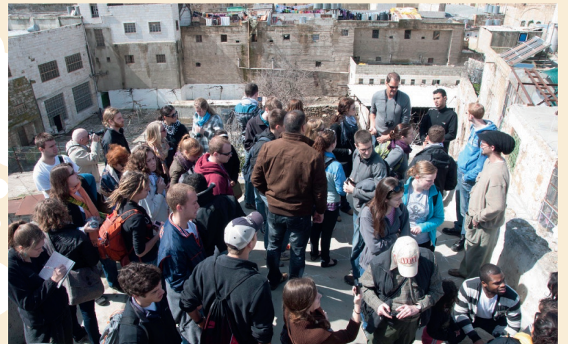
De studerende besøgte flere byer på Vestbredden.

Når jeg tænker tilbage på mine egne oplevelser af vores tid i Israel, kan jeg genkende mange af de indtryk og tanker, som de studerende giver udtryk for i deres blogs. Ligesom dem fik jeg meget hurtigt den palæstinensiske side af konflikten ind under huden. Det faldt naturligt at få ondt af palæstinenserne, som er den svage part i forhold til Israel. Det svære og komplicerede ved konflikten kom dog først til udtryk, da jeg mødte israelere med lignende oplevelser, men med omvendt fortegn. Det tvang mig til at tænke over konflikten på en mere nuanceret måde. Det er en nødvendighed, men et svært tankemønster at træde ind i, hvis man har forsoning for øje.