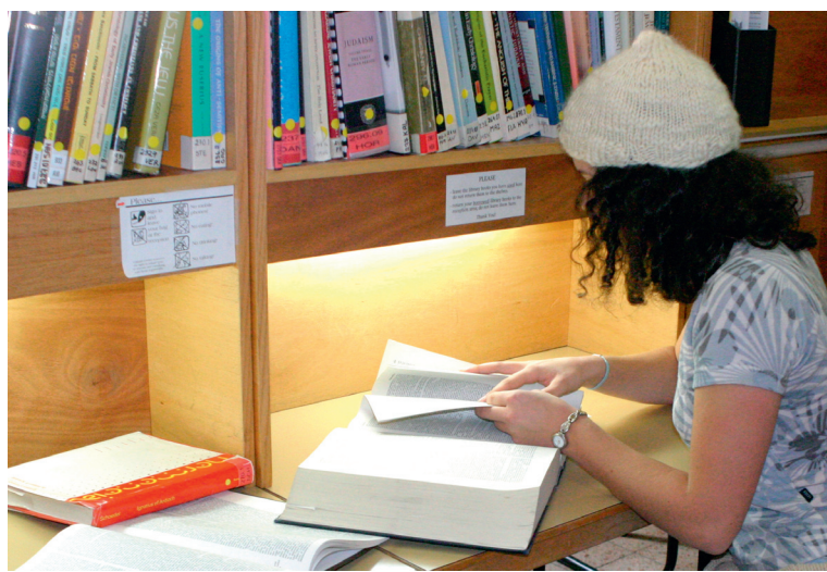
En af Caspari Centers brugere studerer på det gamle bibliotek.

pari Centret, er medredaktør på. Til bogen har i alt 15 prominente skikkelser inden for den messianske bevægelse bidraget. Udgiverne har en forventning om, at bogen bliver en vigtig ressource for dem, som gerne vil beskæftige sig med teologiske problemstillinger på et lidt dybere niveau. Bogen, som kommer til at hedde "Chosen to Follow: Jewish Believers through History and Today" vil kunne bestilles på Amazon til november.