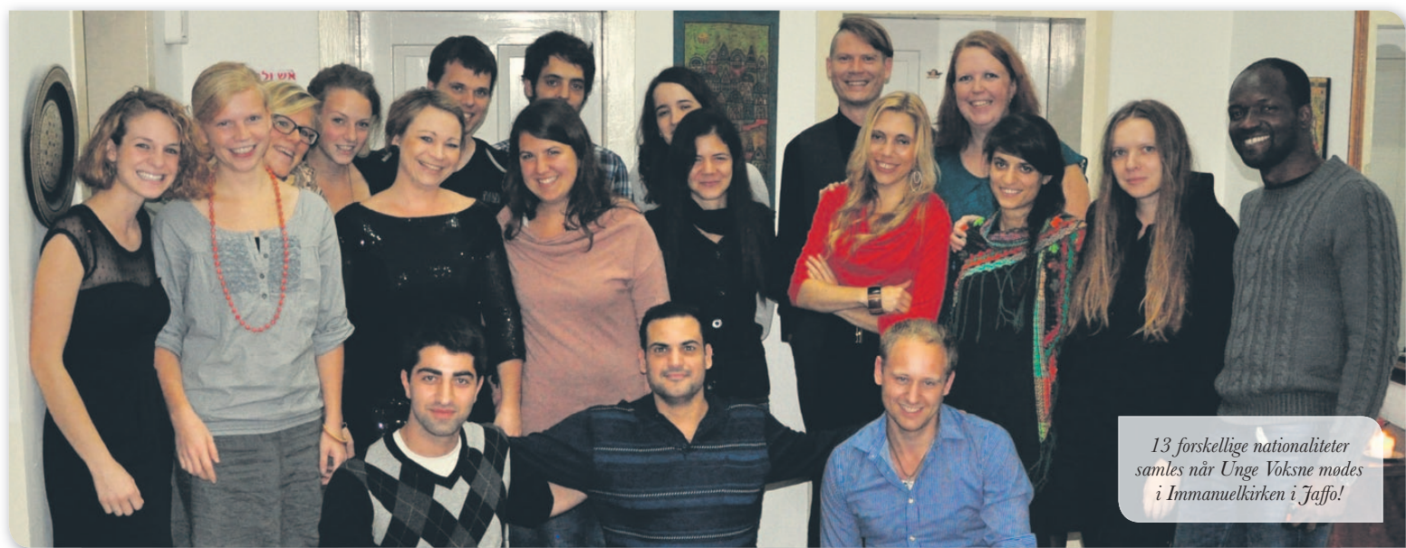
13 forskellige nationaliteter samles når Unge Voksne mødes i Immanuelkirken i Jaffo!