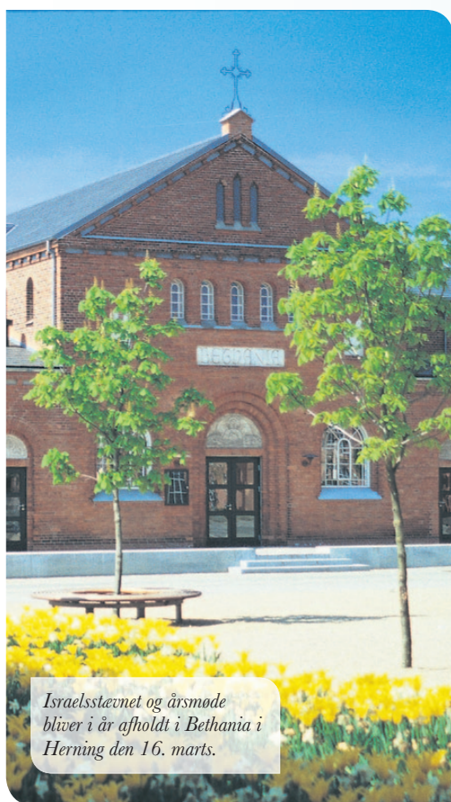
Israelsstævnet og årsmøde bliver i år afholdt i Bethania i Herning den 16. marts.

Tema: Når jøder møder Jesus - om tro, dåb og identitet.