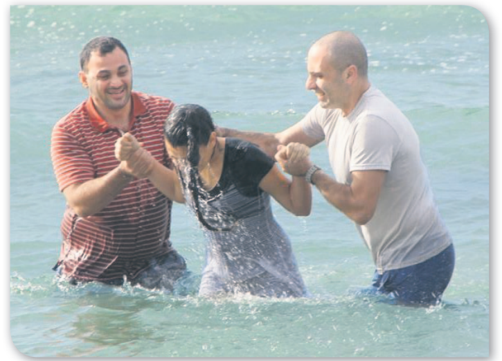
Messiansk dåb i Middelhavet i dag. Israelsmissionens folk i første halvdel af det 20. århundrede ville nok rynke på næsen ad noget sådant. I Immanuelkirken i Jaffo bruger man almindeligvis kirkerummet. Hvad man end foretrækker: dåb i Middelhavet udgør en offentlig bekendelse.