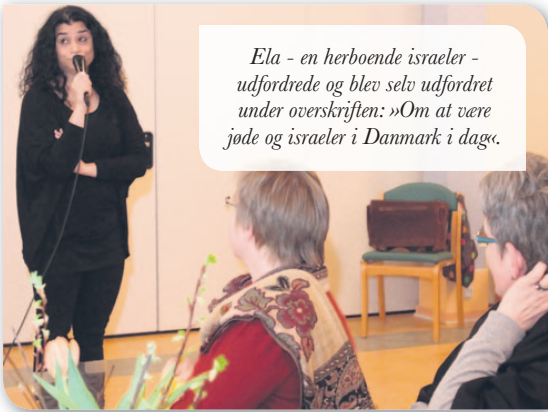
Ela - en herboende israeler - udfordrede og blev selv udfordret under overskriften: »Om at være jøde og israeler i Danmark i dag«.

Er du vores nye præst og teologiske medarbejder? Se mere på israel.dk