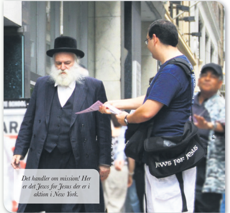
Det handler om mission! Her er det Jews for Jesus der er i aktion i New York.

Påskan giver os vores identitet - Pinsen giver os vejledning til at udleve den i den verden, vi er sat i.