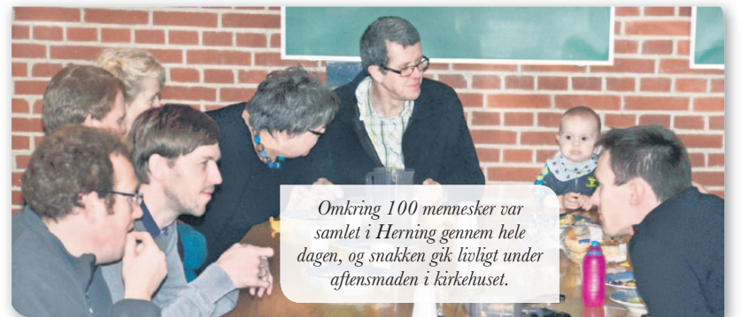
Omkring 100 mennesker var samlet i Herning gennem hele dagen, og snakken gik livligt under aftenmaden i kirkehuset.