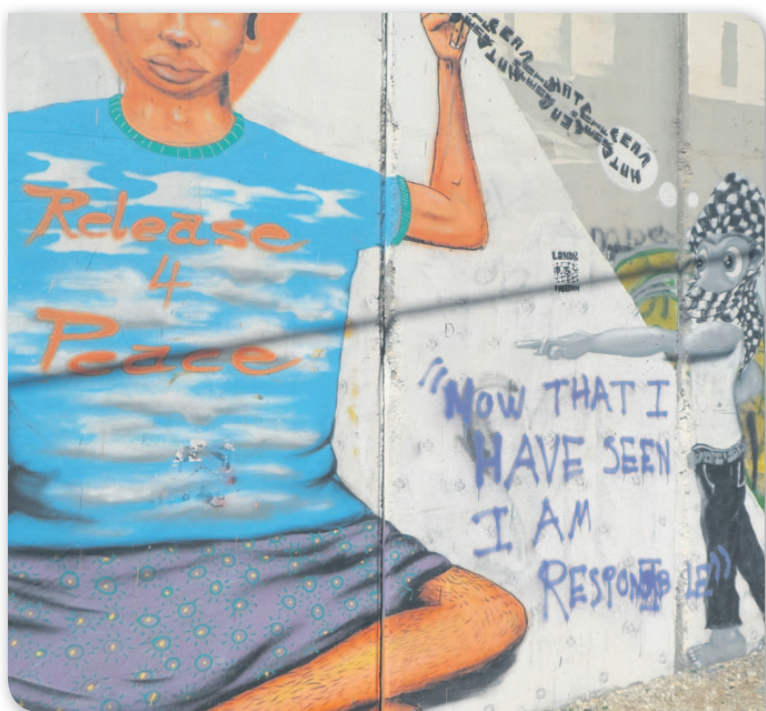
Palæstinensere bruger bl.a. »sikkerhedsmuren« langs grænsen til Vestbredden til at formidle deres fortælling. Her er det et billede fra muren i Betlehem.