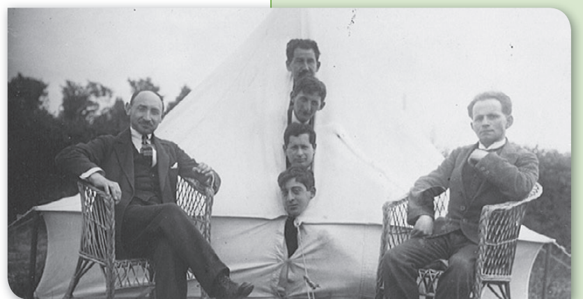
Fra en teltlejr for unge jødiske mænd i 1923 - med gæster siddende udenfor.