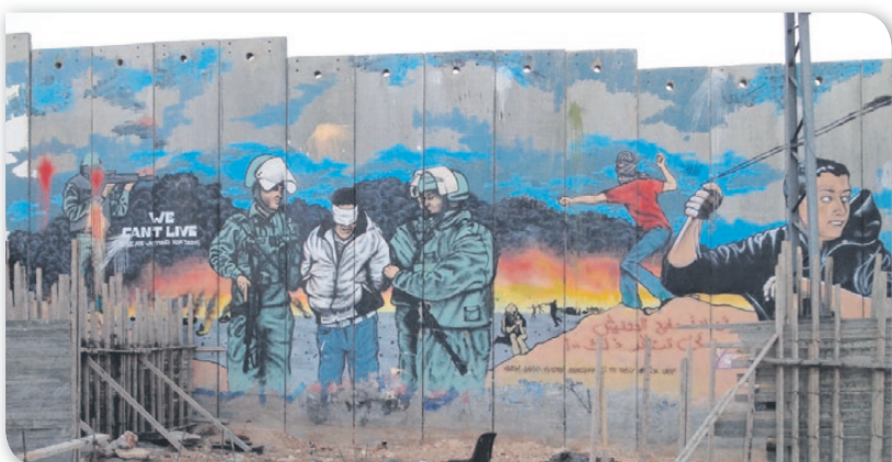
Palæstinensere bruger bl.a. »sikkerhedsmuren« langs grænsen til Vestbredden til at formidle deres fortælling. Her er det et billede fra muren i Betlehem.

Læs hele artiklen om palæstinensiske og israelske narrativer på israel.dk .