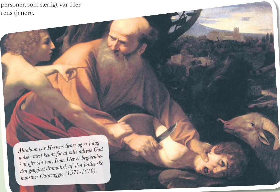
Abraham var Herrens tjener og er i dag måske mest kendt for at ville adlyde Gud i at ofre sin søn, Isak. Her er begivenheden gengivet dramatisk af den italienske kunstner Caravaggio (1571-1610).