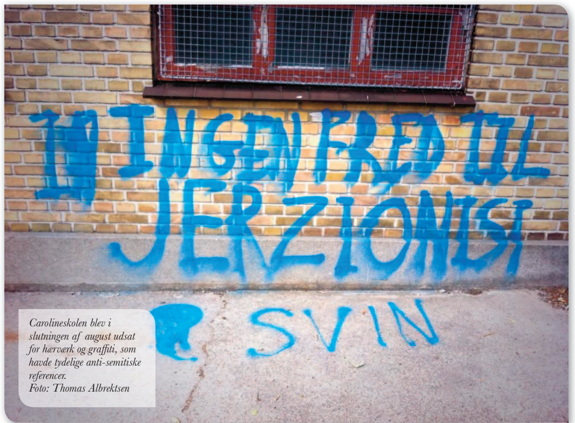
Carolineskolen blev i slutningen af august udsat for hærverk og graffiti, som havde tydelige anti-semitiske referencer.

Når kujoner, der ikke tør stå frem, smadrer vinduer og skriver hadsk graffiti på en jødisk skole, er det antisemitisme på allerlaveste niveau.