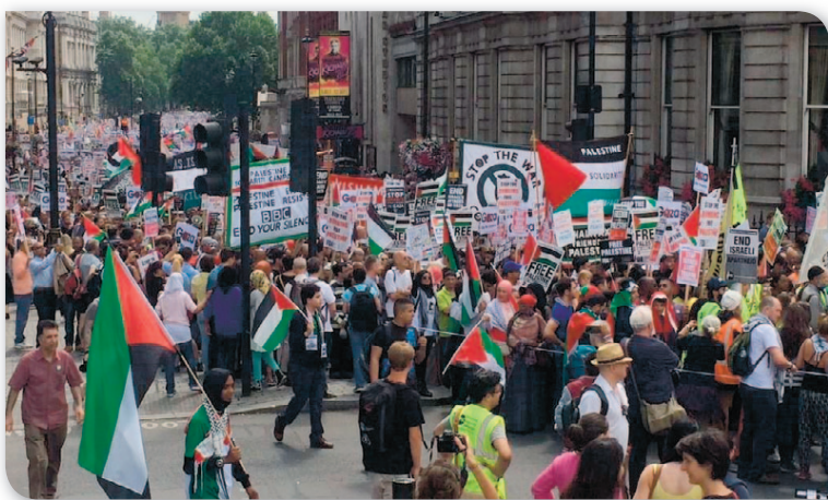
Overalt i Europas storbyer var der demonstrationer mod Israels krigshandlinger i Gaza. Her er det en stor demonstration i London.

I Paris' gader råber de jo ikke »Død over israelere«. De råber »Død over jøderne«. Det stikker langt dybere end blot krigen i Gaza.