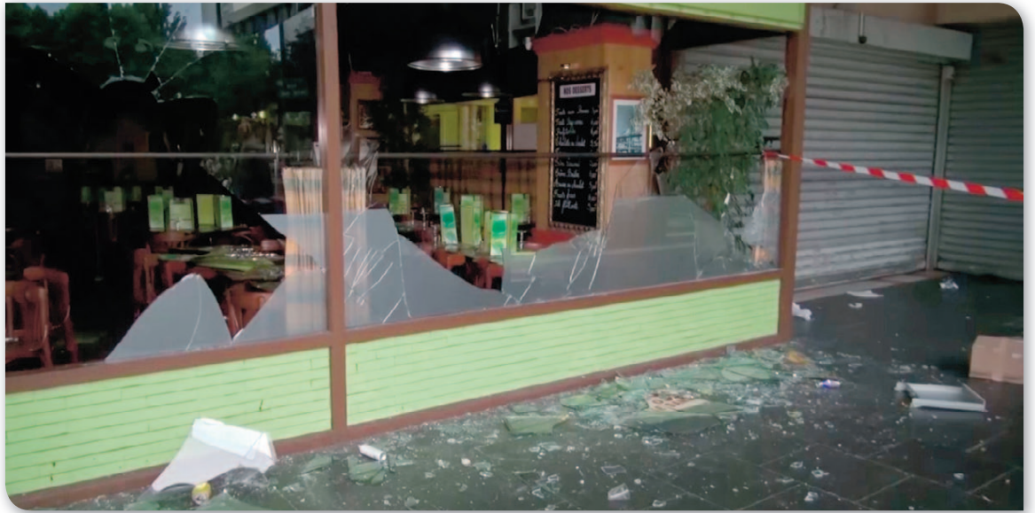
En fransk-jødisk restaurant i Pariser-forstaden Sarcelles er blevet smadret af anti-israelske demonstranter.