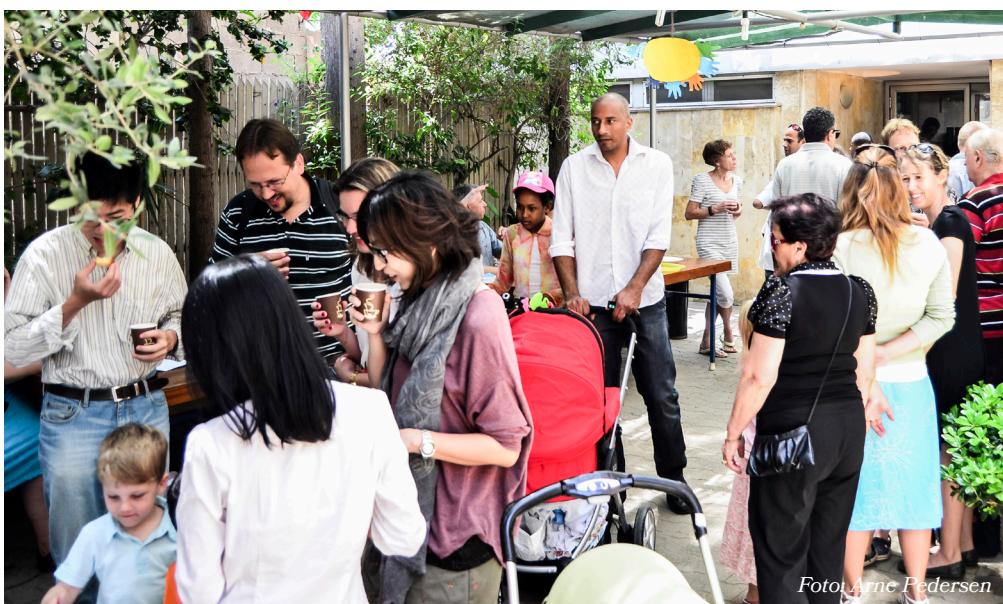
◀ Gården foran Immanuelkirken hvor børnene mødes under gudstjenesten - og hvor der også serveres kirkekaffe.

Det er også en stor glæde for mig, at vi har en ungdomsgruppe i kirken. I øjeblikket mødes de to gange om måneden, hvor de følger en serie kaldet "Bibelprojektet". Det er en serie af korte animationsfilm, der handler om bøger i bibelen eller bibelske emner. Når de ikke mødes i deres egen gruppe, hjælper de ofte med de mindre børn. Vi er så velsignet med vores teenagere i kirken! Vi har et rigtig godt program for både børn og teenagere i kirken, synes jeg. Det er godt at vide, at der er indhold med substans at tilbyde til børn og unge, som kommer ind i kirken, og vi ville ønske at flere familier fandt vej gennem vores døre. Bed for os! <<