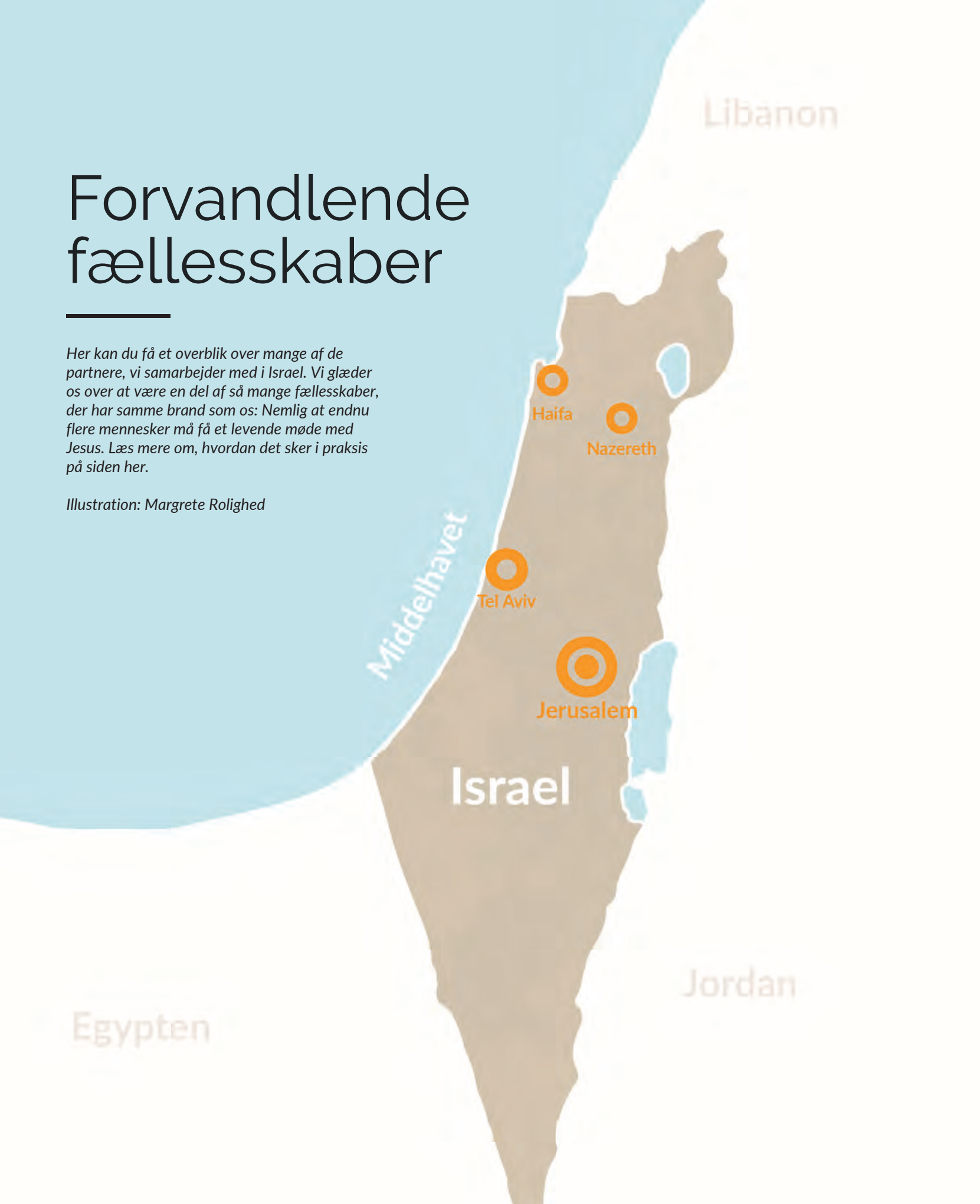
Illustration: Margrete Rolighed

Her kan du få et overblik over mange af de partnere, vi samarbejder med i Israel. Vi glæder os over at være en del af så mange fællesskaber, der har samme brand som os: Nemlig at endnu flere mennesker må få et levende møde med Jesus. Læs mere om, hvordan det sker i praksis på siden her.