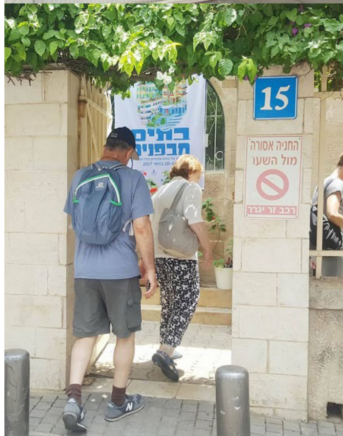
Øverst: Bibelbutikken, som den ser ud i dag i Tel Aviv. Nederst: Indgangen til Immanuelkirken og snart også til Bibelbutikken.